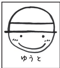
○ よいイラストの一例